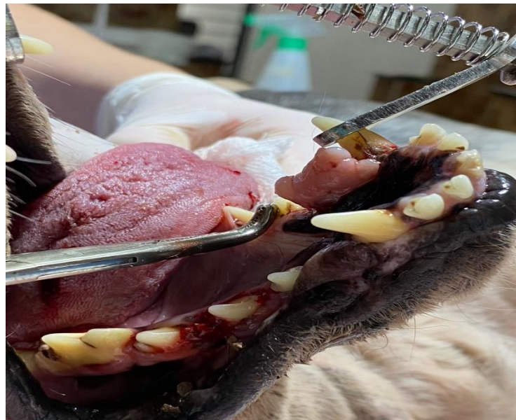
Figura 1. Massa exóftica, aderida ao redor do canino inferior esquerdo.

Vale ressaltar, que após a retirada da massa e o procedimento de tartarectomia, o animal se alimenta normalmente, sem dor, halitose ou sangramento gengival.